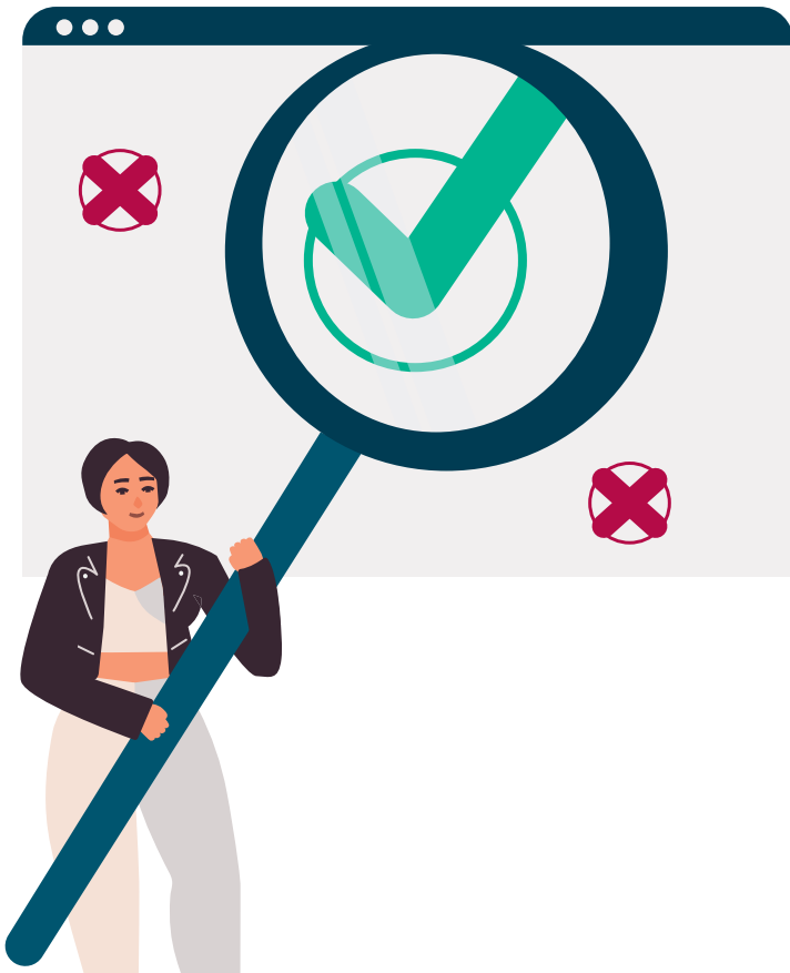
วิธีการค้นหาข้อมูลสุขภาพที่ดีทางออนไลน์